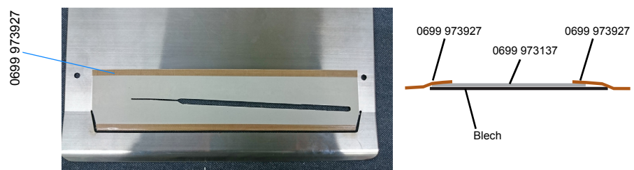
Abb. 3: Formsätze bekleben (3)