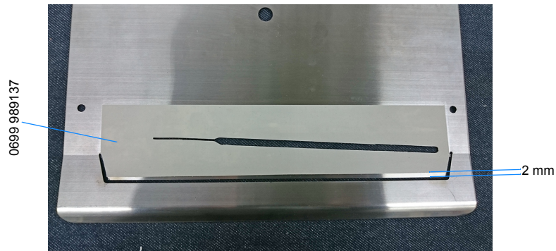
Abb. 1: Formsätze bekleben (1)